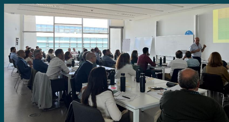
AÇÕES DE CAPACITAÇÃO